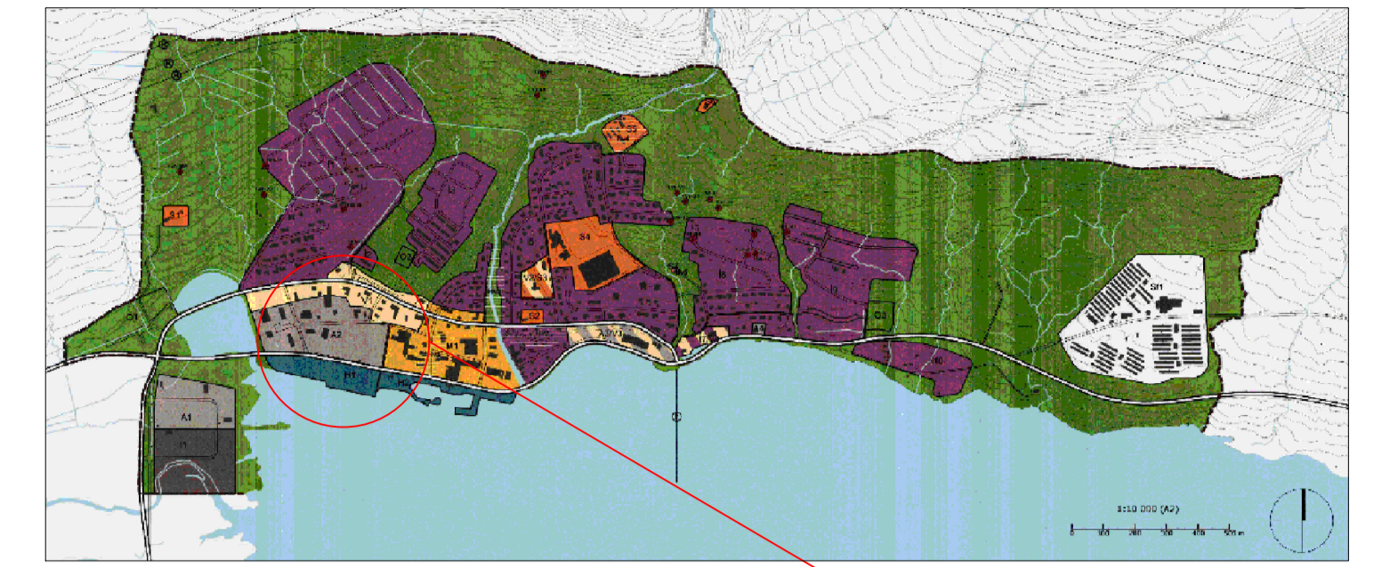
STADSETNING Í ADALSKIPULAGI