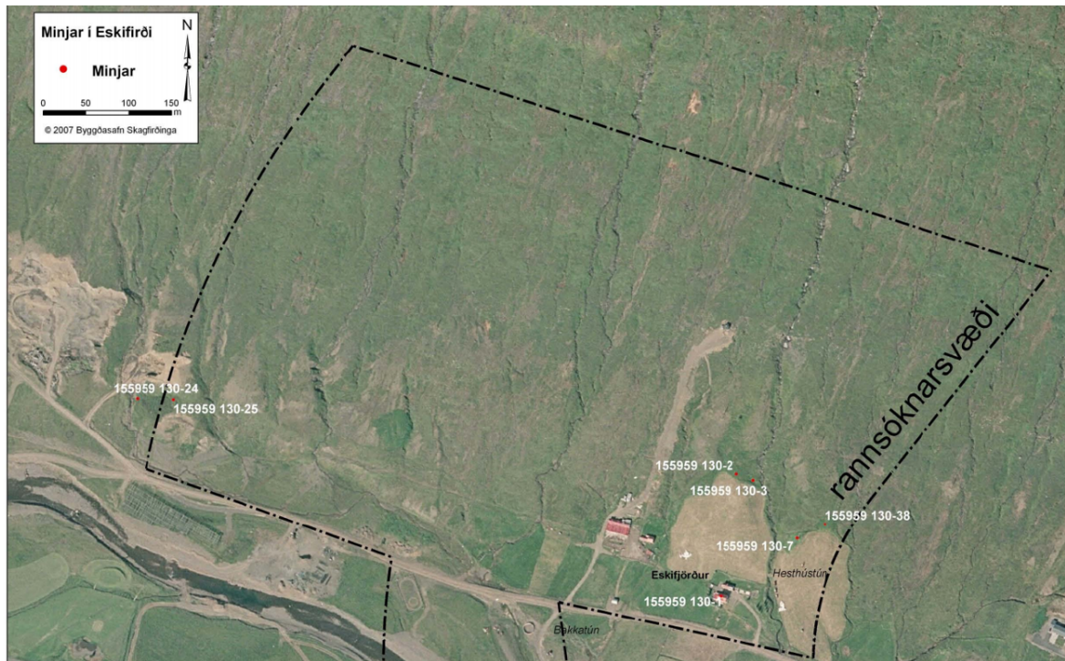
Mynd 7-1. Yfirlitsmynd yfir fornminjar við Eskifjörð.

Garðlag (rétt?) [155959 130-24] liggur rétt vestan áðurnefnds stekkjjar. Sökum gróðurs var ekki auðvelt að greina hvernig mannvirki er um að ræða en þarna virðist a.m.k vera garðbrot og greinanlega einhver niðurgroftur.