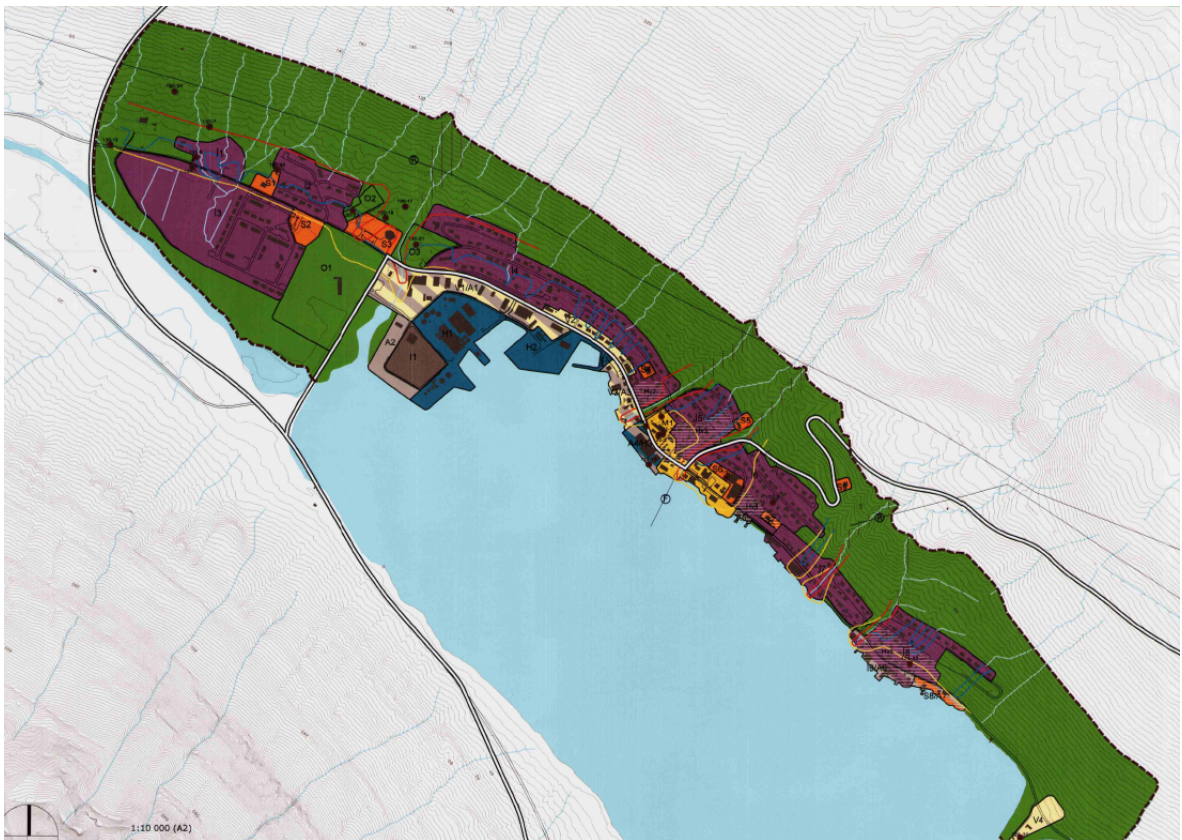
Mynd 5-2. Gildandi Aðalskipulag Fjarðabyggðar 2007-2027, þéttbýlisuppráttur fyrir Eskifjörð.

Dalur 2: Deiliskipulag íbúðarsvæðis, samþykkt 06.04.2000.