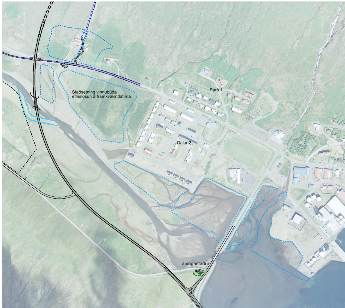
Mynd 7-2. Yfirlitsmynd yfir uppfyllingarsvæði innan Eskifjarðar sem staðsett verða við sundlaugin og fyrir ofan hafnarsvæðið.

Tímabundnar fyllingar verða á vinnusvæði sunnan Dalbrautar og vestan íbúðabyggðar, Dalur 2.