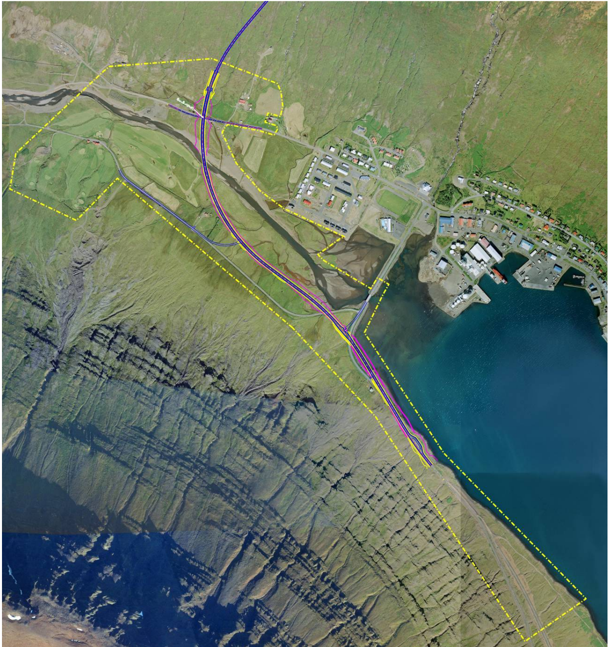
Mynd 4-1. Afmörkun deiliskipulagssvæðis er sýnd með gulri brotalínu.