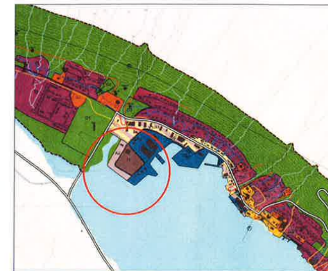
Aðalskipulag Fjarðabyggðar 2007-2027 Þéttbýlisuppdráttur fyrir Eskifjörð