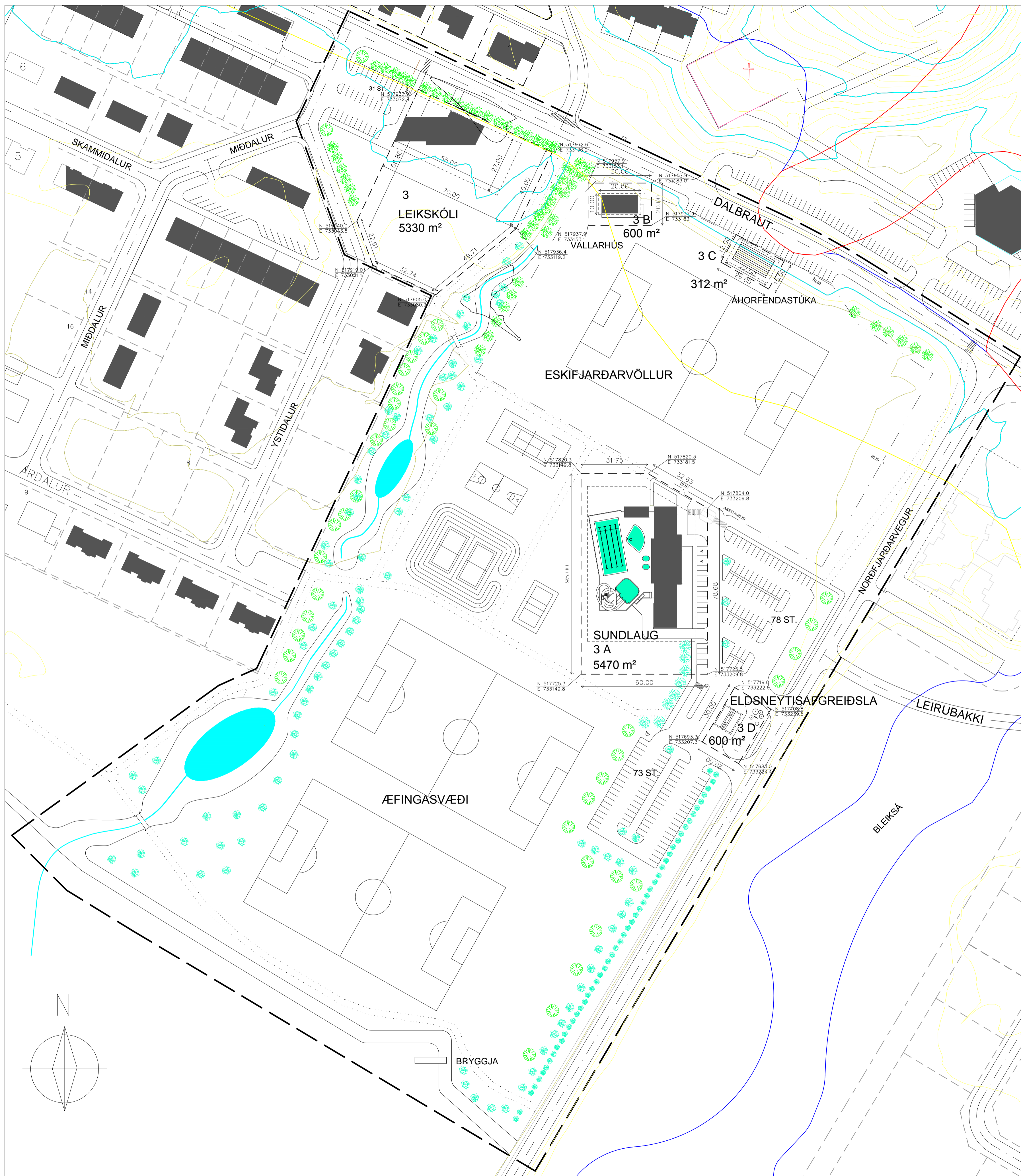
Breytt deiliskipulag, Dalur 1 Kvarði 1:1000