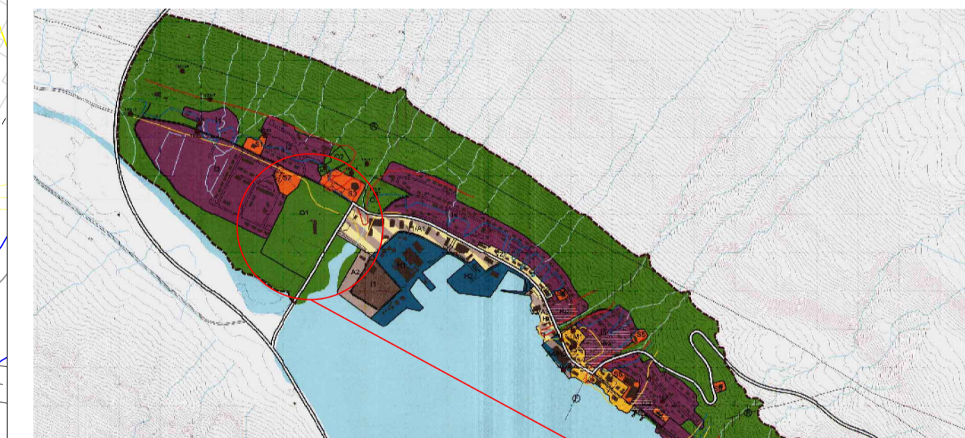
Staðsetning í aðalskipulagi

Öll mál á upprætti þessum eru í metrum nema annað sé tekið fram