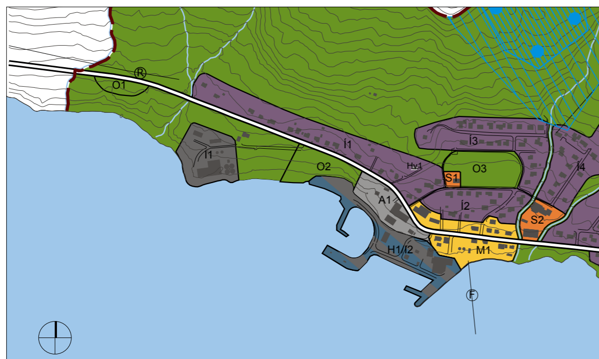
Tillaga að breytingu, dags. 13. mars 2013