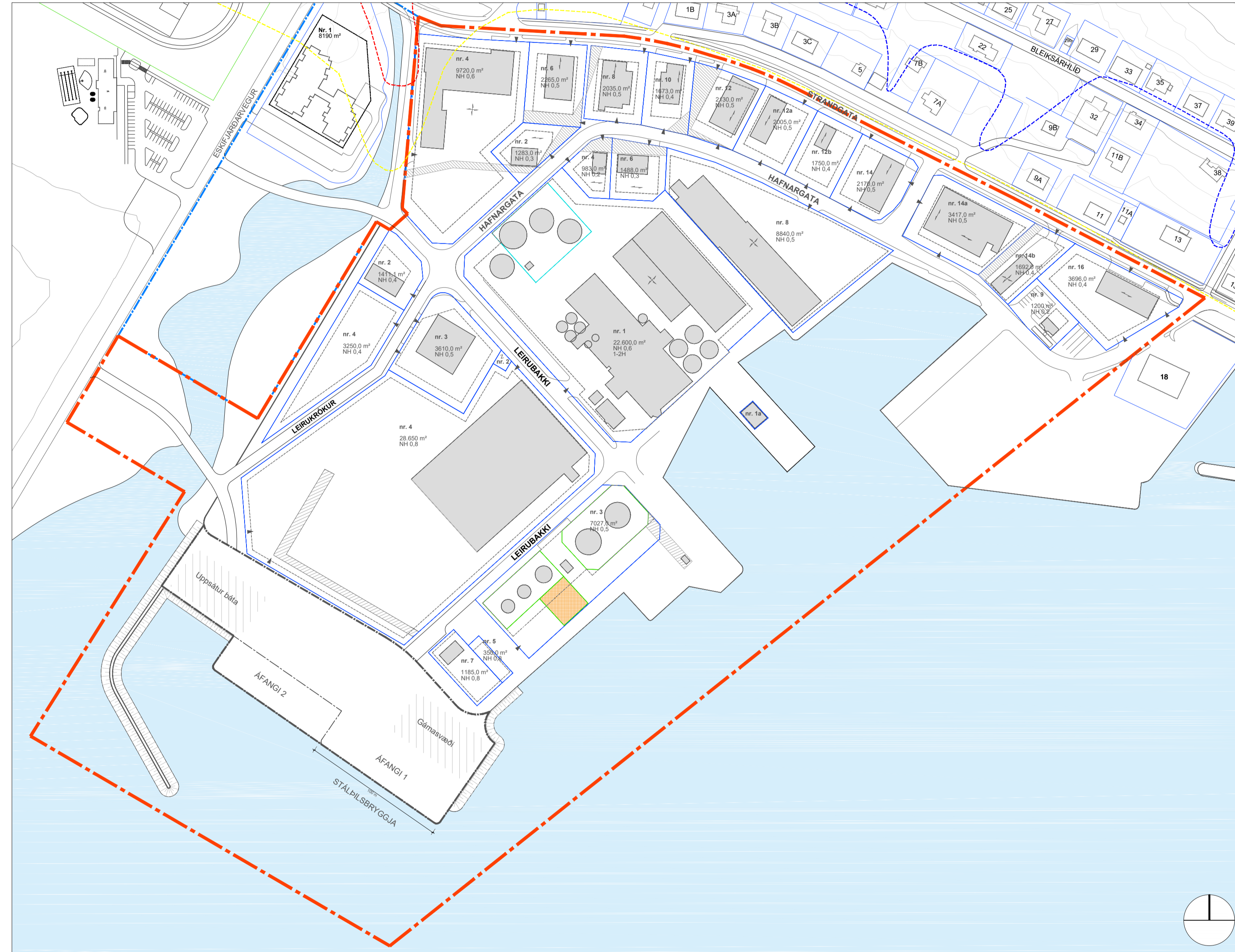
Tillaga að deiliskipulagi: Leira 1, iðnaðar- og hafnarsvæði sunnan Strandgötu í mkv. 1:2000