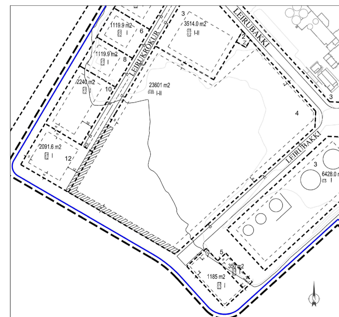
Hluti deiliskipulags Leiru 1, iðnaðar- og hafnarsvæði sunnan Strandgötu. Breyting dags 4.2.2016 í mkv. 1:2000

Deiliskipulag þetta sem fengið hefur meðferð í samræmi við ákvæði 40. gr. skipulagslaga nr. 123/2010 m.s.br. var samþykkt í umhverfis- og skipulagsráði _____ 2018 og í bæjarstjórn _____ 2018.