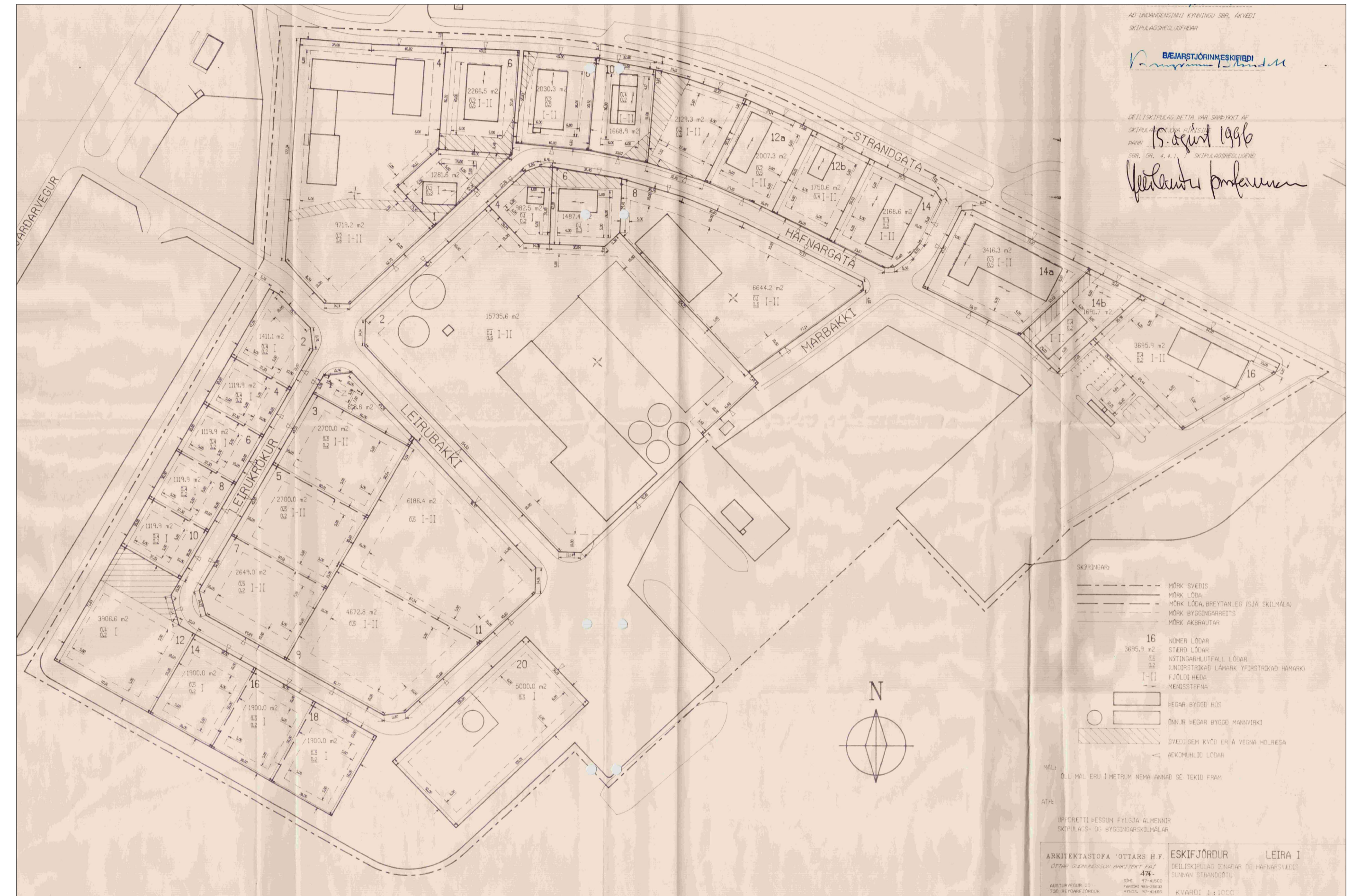
Deiliskipulag Leiru 1, iðnaðar- og hafnarsvæði sunnan Strandgötu dags. 20.6.1994 í mkv. 1:2000