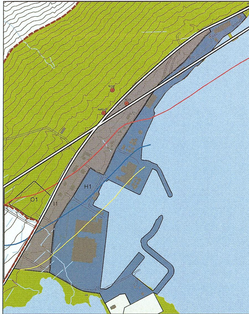
Gildandi aðalskipulag, staðfest 24. ágúst 2009 m.sbr.

Aðalskipulagsbreyting þessi var staðfest af Skipulagsstofnun þann _____ 2015