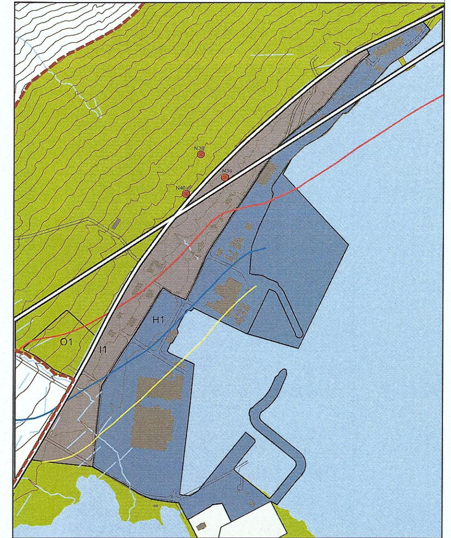
Tillaga að breytingu, dags. 3. júní 2015