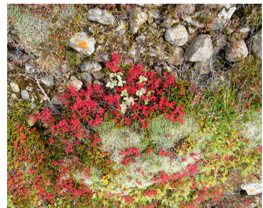
Þærni um vistkerfi sem lupluna ríðlar.

samkvæmt rannsóknunum þeirra höfðu breiðst hrat út í Fjarðabyggð og stofu Austurlands (NA) hefur lupluna Samkvæmt heimildum frá Náttúru-íslenstra náttúru.