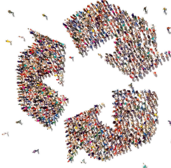
Goður úrgangur í endurvinnslu fæst þegar allir leggja sitt að mörkum; sveitarfélagið, íbúarnir, og rekstraráðilar.

Allur úrgangur sem ekki er flokkaður til endurvinnslu er urðaður á urðunarstað Fjarðabyggðar í Þernunesi. Margt mælir með því að draga úr urðun úrgangs. Þetta er afar kostnaðarsamt úrræði og getur verið skadlegt umhverfinu. Það sem er urðað tekur langan tíma að brotna niður, sérstaklega við aðstæður eins og á Íslandi. Plastpoki brotnar niður á 500-1000 árum á urðunarstað og plastflaska á hátt í 450 árum.