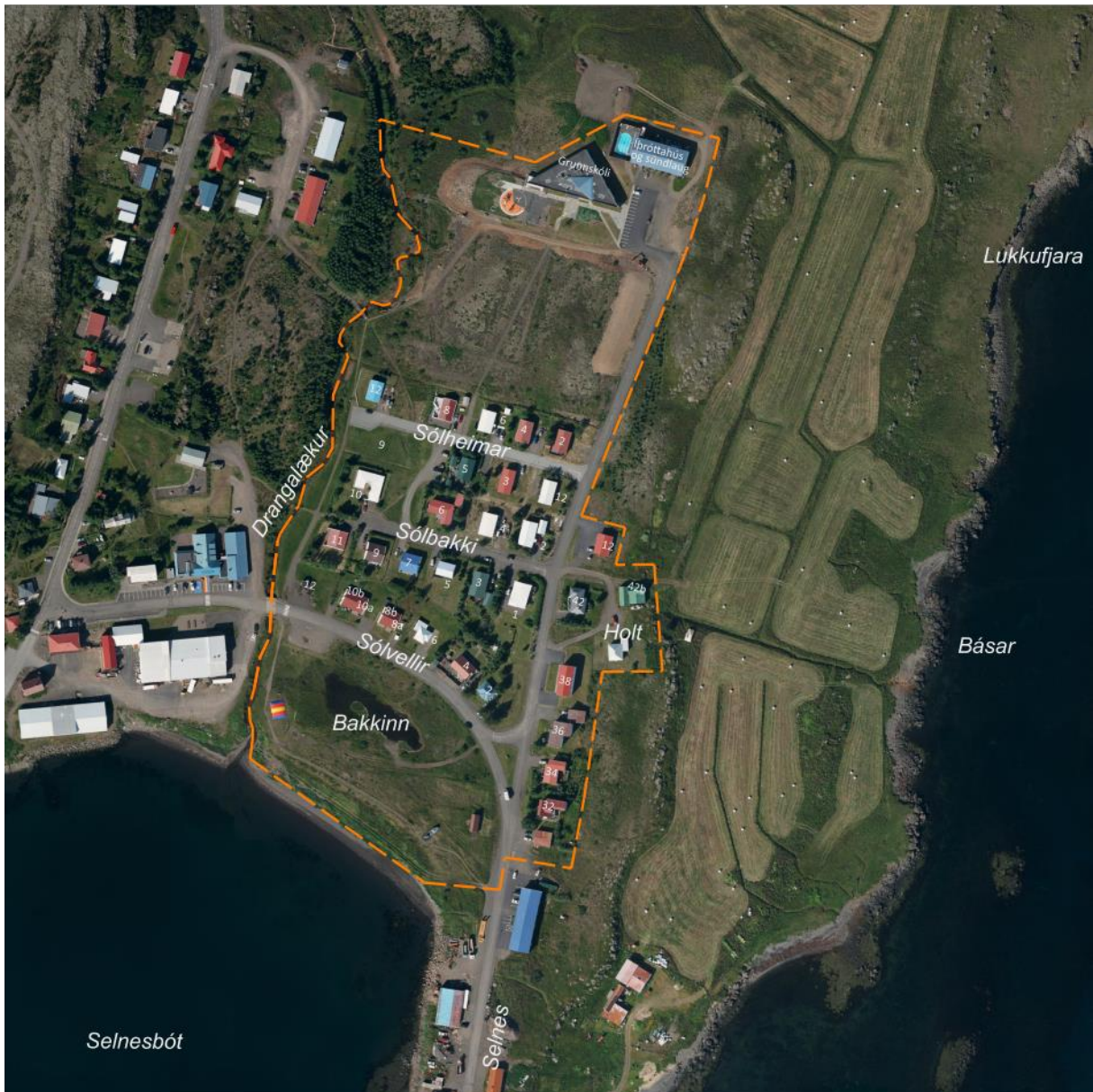
Mynd 1: Afmörkun húsaskráningar (appelsínugul lína) og húsnúmer.

Í þessari skýrslu er að finna einfalda húsaskráningu fyrir hús innan marka nýs deiliskipulags á Breiðdalsvík. Skráningin er gerð í samráði við Minjavörð Austurlands. Svæði húsaskráningar hefur sömu afmörkum og deiliskipulagstillagan, heildar stærð svæðisins er um 9,5 ha. Afmörkun miðast við Drangalæk í vestri, Breiðdals- og Stöðvarfjarðarskóla í norðri, af götunni Selnes í austri ásamt lóðum við Selnes 12-32 og að fjörunni fyrir botni Selnesbótar (sjá mynd 1).