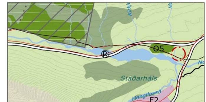
Hluti af staðfestu aðalskipulagi Fjarðabyggðar 2007-2027.

Breytingin felur í sér að gert er ráð fyrir byggingarreit fyrir steypustöð innan vinnubúðasvæðis. Samkvæmt gildandi deiliskipulagi var einn byggingarreitur innan vinnubúðasvæðis, reitur fyrir vinnubúðir en gert var ráð fyrir steypustöð á athafnasvæði við gangnamuna. Eftir að framkvæmdir hófust hefur komið í ljós að erfitt er að koma fyrir steypistöð innan athafnasvæðis sökum erfiðra aðstæðna og slakra efnisgæða.