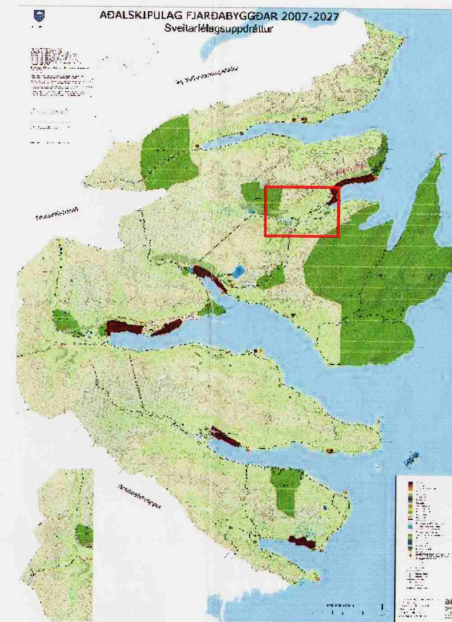
Svæðið sem breytingin nær yfir

Breyting á leiðarvali mun ekki breyta því að nýr Norðfjarðarvegur mun hafa verulega jákvæð áhrif á samfélagið.