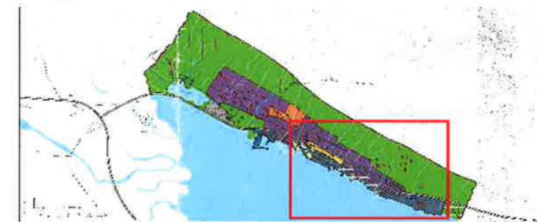
Svæðið sem breytingin nær yfir

ADALSKIPULAG FJARÐABYGGÐAR 2007-2027 Þéttbýlisuppráttur fyrir Fáskrúðsfjörð