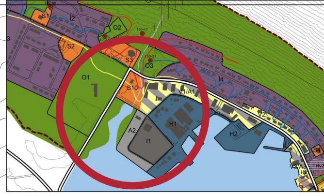
Hluti úr Aðalskipulagi Fjarðarbyggðar 2007-2027