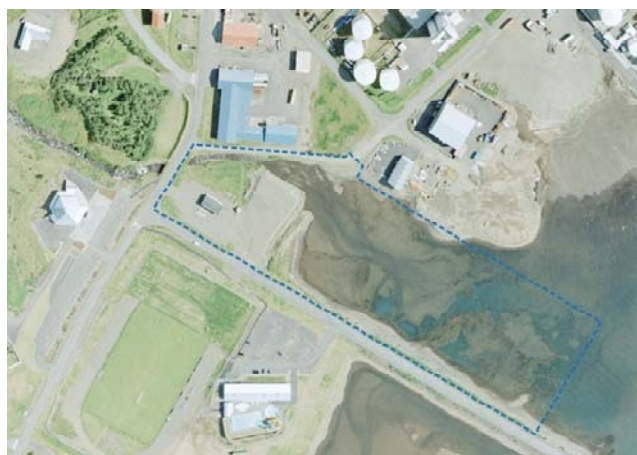
Mynd 1. Yfirlitsmynd (Teiknistofan Storð ehf, 2011).

Í gildandi deiliskipulagi fyrir iðnaðar- og athafnasvæðið á Leiru vestan svæðisins er gert ráð fyrir veltengingu yfir leiruna sunnan lóðarinnar fyrir hjúkrunarheimilið og tengist sá vegur inn á Norðfjarðarveg.