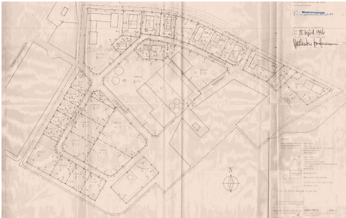
"Leira 1 - deiliskipulag iðnaðar- og hafnarsvæðis sunnan Strandgötu"