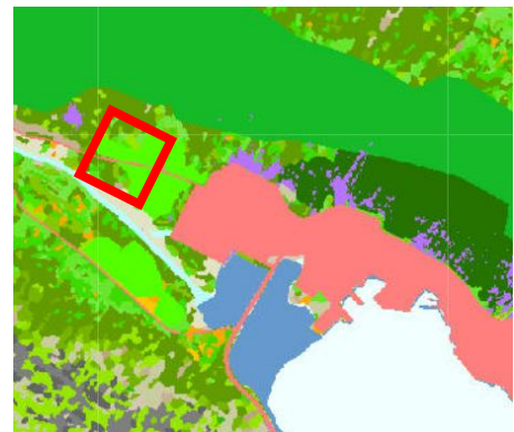
Mynd 3: Brot úr kortinu Vistgerðir og mikilvæg fuglasvæði á Íslandi. Rauður kassi sýnir skipulagssvæðið (Náttúrufræðistofnun Íslands, 2018).

Hafa ber í huga að útgáfa gagnanna er frá árunum 2017-2018 og nákvæmni vistgerðakortanna er miðuð við mælikvarðann 1:25.000 til 1:50.000 og því ekki í sama kvarða og deiliskipulagið er unnið í en ávallt skal gæta þess að spilla gróðri og þar með vistgerðum sem minnst við framkvæmdir.