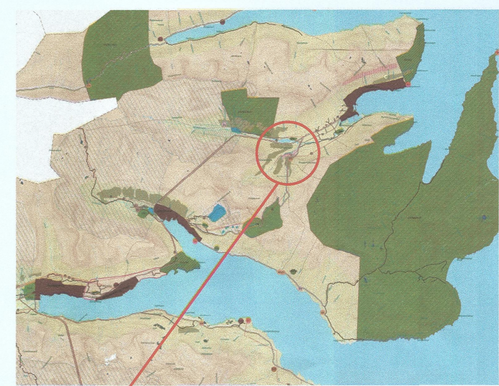
STAÐSETNING Í ADALSKIPULAGI