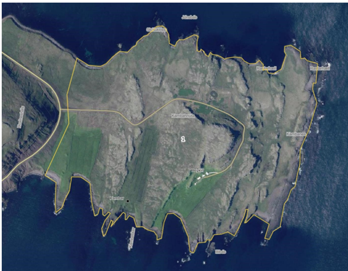
Mynd 1: Kambanes við sunnanverðan Stöðvarfjörð.

Á jörðinni Heyklif við sunnanverðan Stöðvarfjörð í Fjarðabyggð er stefnt að uppbyggingu ferðaþjónustu og m.a. gert er ráð fyrir gístaðstöðu og veitingaþjónusta á svæðinu. Til stendur að vinna tillögu að nýju deiliskipulagi fyrir svæðið og um leið gera tillögu að breytingu á Aðalskipulagi Fjarðabyggðar 2007-2027 til að áformuð uppbygging verði í samræmi við aðalskipulag. Uppbyggingin fellur undir lög um mat á umhverfisáhrifum nr. 106/2000 og tillögunum mun því fylgja umhverfisskýrsla þar sem gerð verður grein fyrir umhverfisáhrifum skipulagstillagnanna. Stefnt er að því að umhverfisskýrsla deiliskipulagstillögunnar verði efniviður í tilkynningu framkvæmdaraðila vegna mats á umhverfisáhrifum framkvæmdarinnar en Skipulagsstofnun mun taka ákvörðun um hvort framkvæmdin skuli háð mati samkvæmt lögum. Skipulags- og matslýsing sem hér er sett fram nær bæði yfir tillögu að nýju deiliskipulagi og tillögu að breytingu á aðalskipulagi.