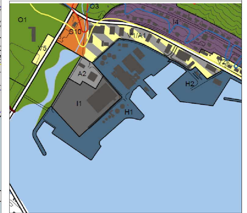
Skýringarmynd: Tillaga að breyttu Aðalskipulagi Fjarðabyggðar 2007-2027, þéttbýlisuppráttur fyrir Eskifjörð.