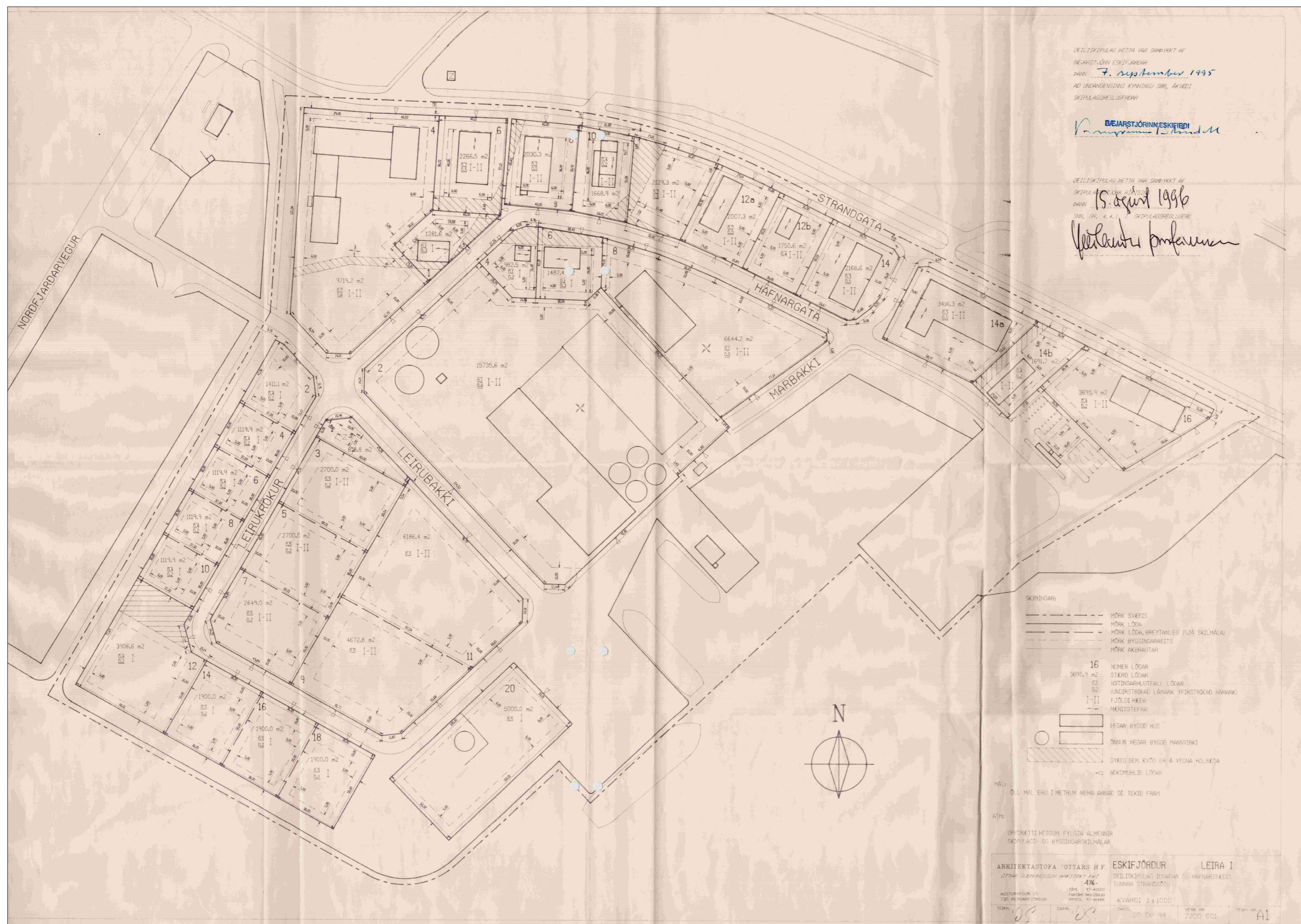
Skýringarmynd: Deiliskipulag Leiru 1, iðnaðar- og hafnarsvæði sunnan Strandgötu dags. 20.6.1994 í mkv. 1:2000