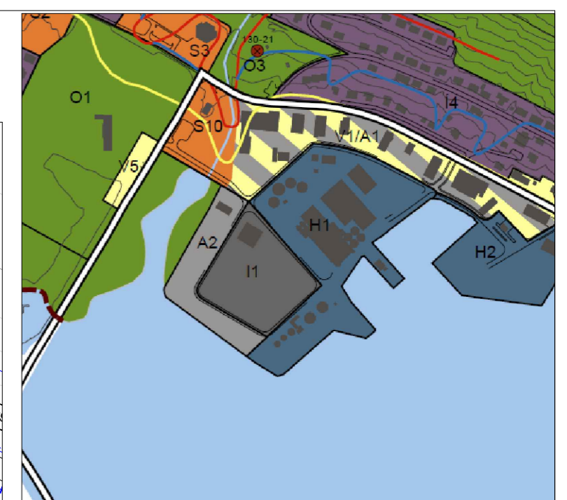
Skýringarmynd: Hluti Aðalskipulags Fjarðabyggðar 2007-2027, þéttbýlisuppráttur fyrir Eskifjörð.