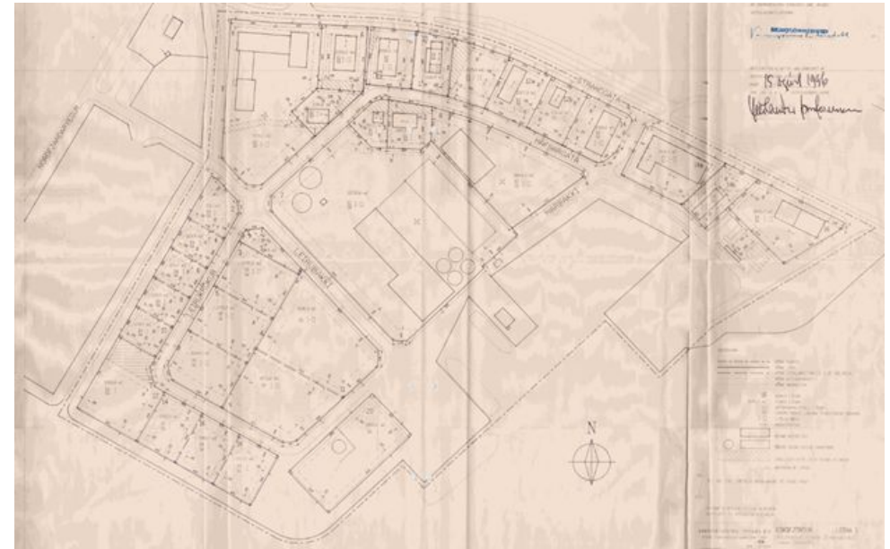
Leira 1 - deiliskipulag iðnaðar- og hafnarsvæðis sunnan Strandgötu frá 1994.