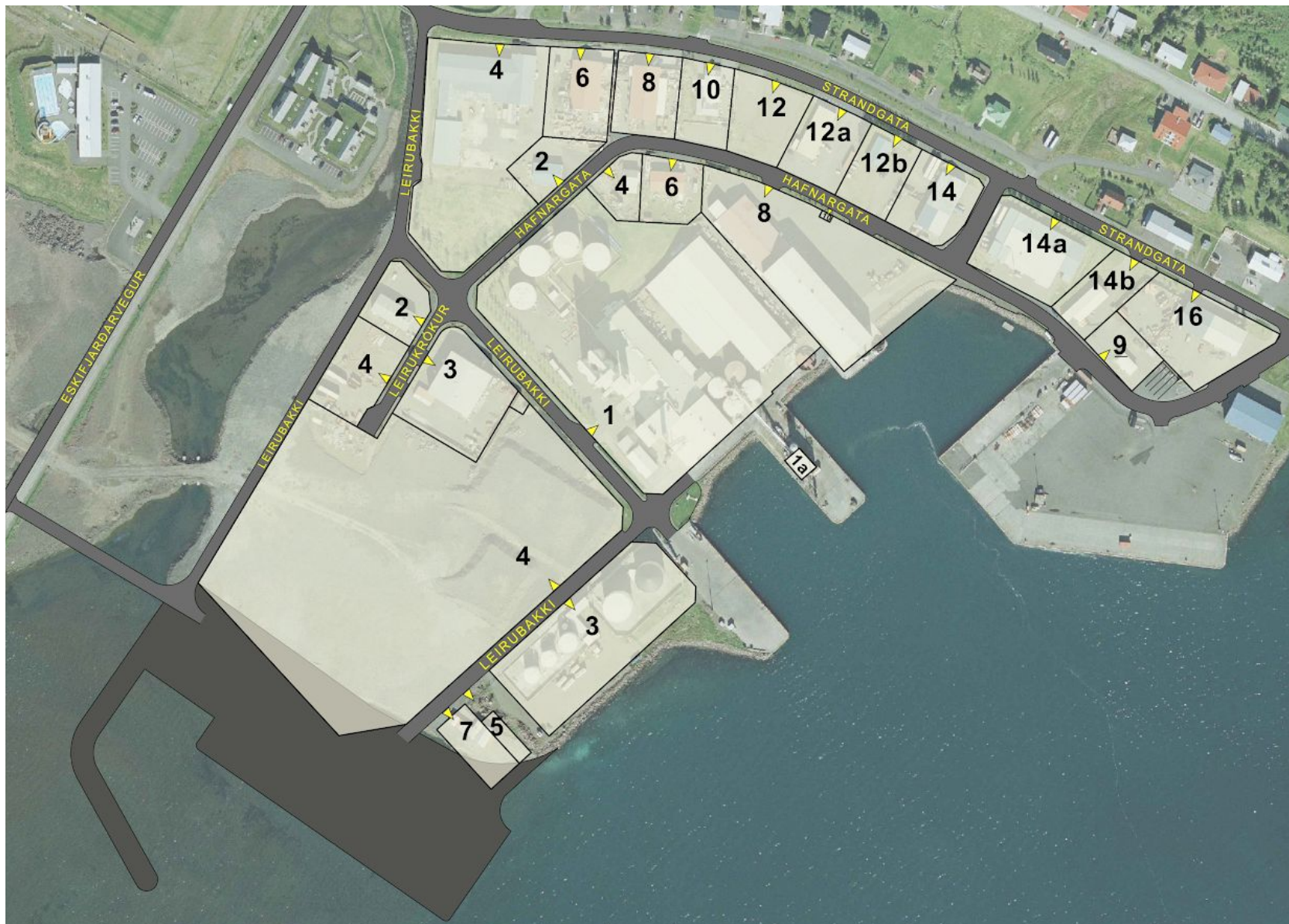
Skýringarmynd: Götuheiti og húsnúmer skv. tillögu að endurskoðun deiliskipulags Leiru