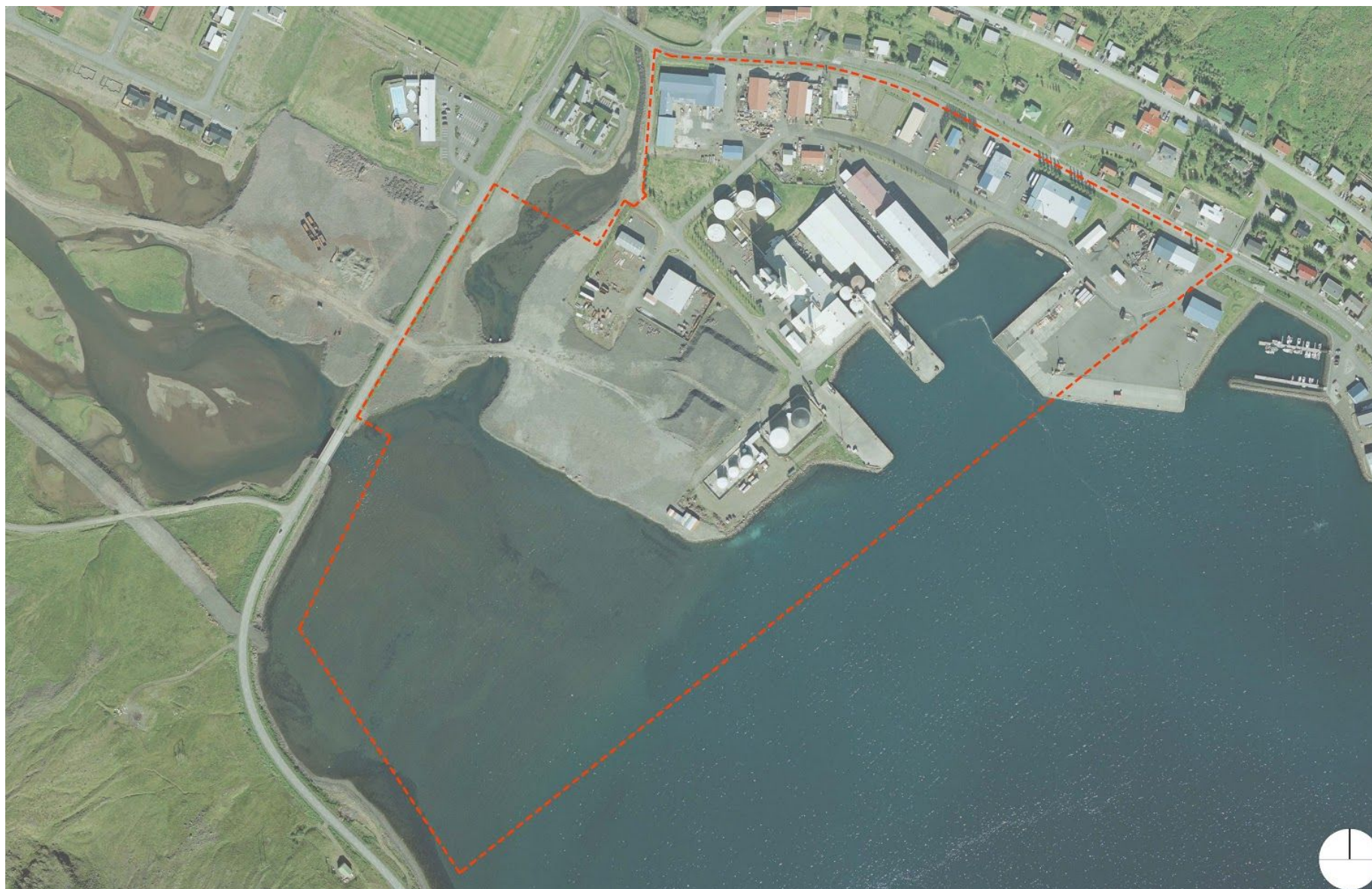
Skýringarmynd: Mörk deiliskipulagssvæðis á loftmynd