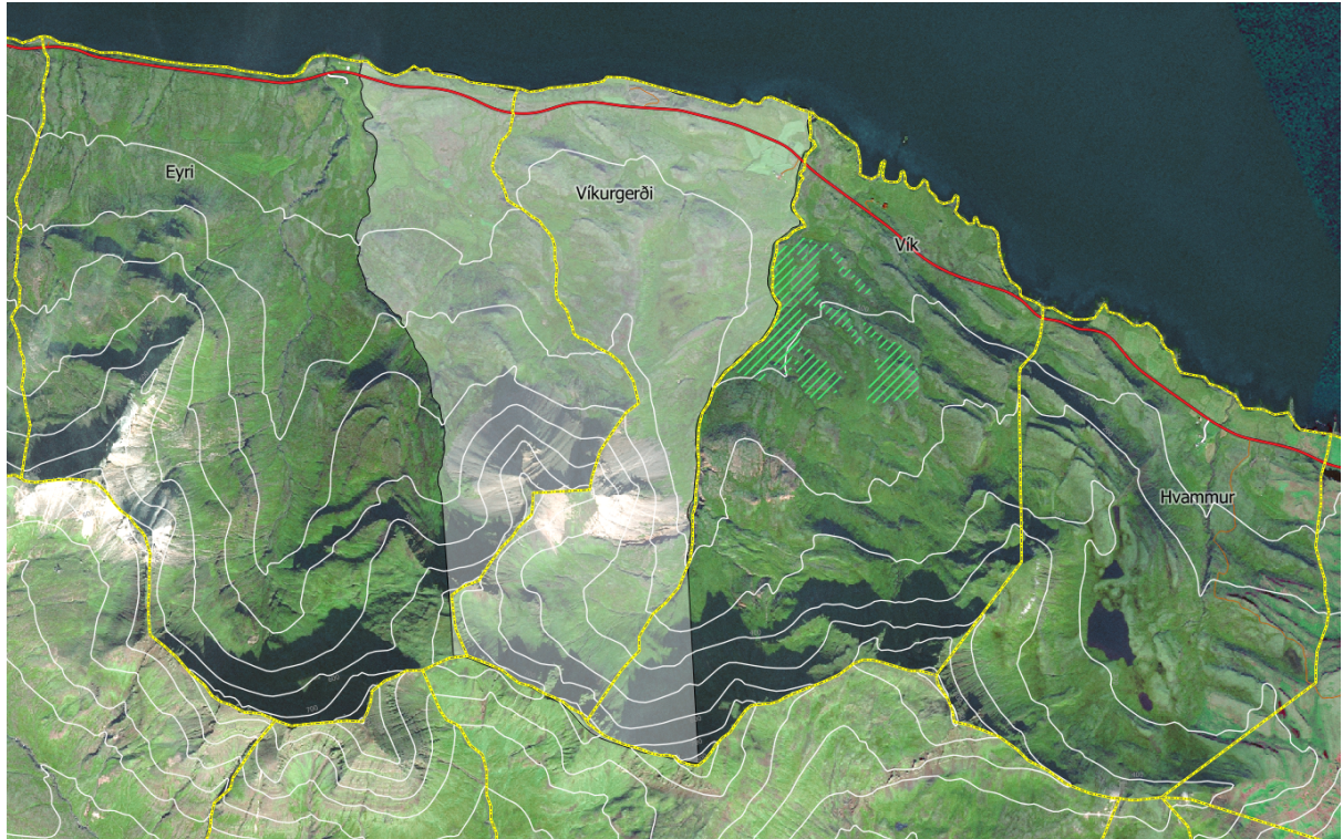
Mynd 2: Jarðir við sunnanverðan Fáskrúðsfjörð. Gul landamerki eru sýnd skv. Nytjalandsskráningu 2006 og kunna að vera ónákvæm. Hverfisverndarsvæði er sýnt með ljósri skyggingu. Skógrækt í landi Víkur kemur fram með grænum skástriku.

Í landi Víkur, sem er næsta jörð austan Víkurgerðis hefur verið plantað blandskógi í rúmlega 50 hektara svæði í 50 - 150 metra hæð.